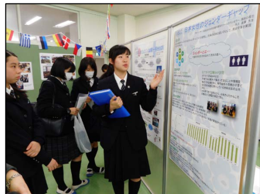
LABO② 日本人女性のジェンダーギャップの研究