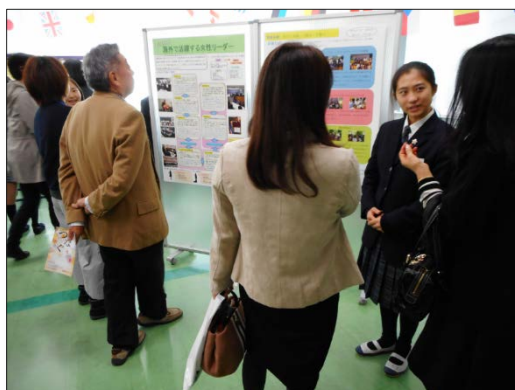
LABO③ 海外で活躍する女性リーダーの研究