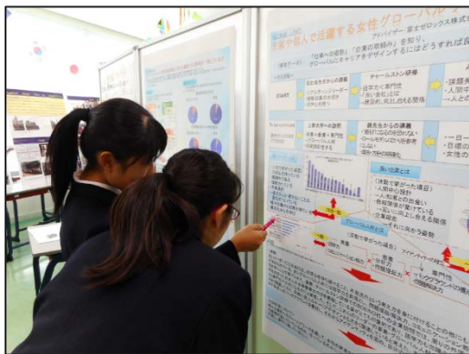
LABO① 企業や個人で活躍する 女性グローバル・リーダーの研究

4つのLABO活動についてはポスターセッションを行い、多くの方々にお集まりいただきました。ご覧いただいた方からは、「タイやカンボジアの女性は社会に出て仕事をしたいという考えを持っているのか」「男は青、女はピンクのように男女の色が決まっていることがなぜ悪いのか」など、様々なご質問をいただきました。また、「女性管理職を数字として増やすのではなく実力のある人を登用すべきである」というご意見や、「男性の育休も女性の育休の待遇と近づけるべきである」という男性のご意見もありました。ポスターセッションという形式をとったことで、これまで学んできたことをお伝えすると共に、多くの考え方を知ることができました。