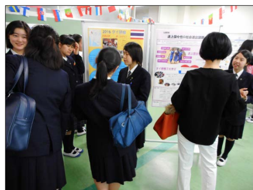
LABO④ 途上国女性の社会進出課題